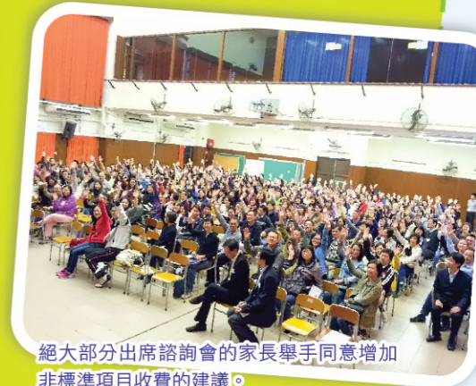
絕大部分出席諮詢會的家長舉手同意增加非標準項目收費的建議。

法團校董會於六月五日所舉行的會議上亦正式通過有關建議。感謝各家長對學校的愛顧與支持。教育事業，任重道遠，有知心同行者，確叫人振奮，更添新力。