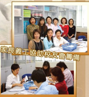
家長義工協助校友會籌備