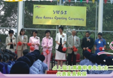
上層校董會會客室及校區發展部