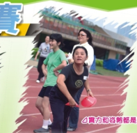
實力超強的媽媽選手